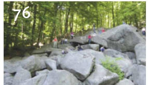
76 Felsenmeer im Geopark Bergstraße-Odenwald.