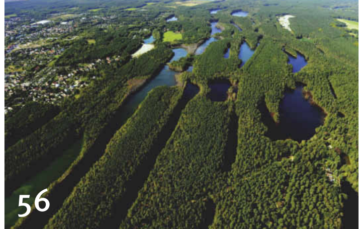
56 Seen und Höhenzüge im Geopark Muskauer Faltenbogen.