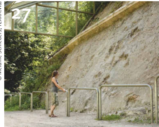
27 Saurierfährten im Geopark TERRA.vita.